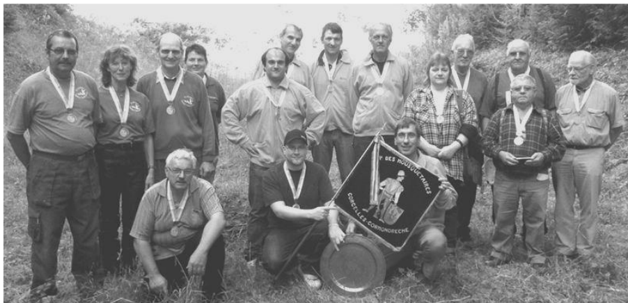
Cornaux-Thielle-Wavre Le Vignoble 2 me

Roi du tir de la finale D : Fort Laurent, La Gentiane: 136 – 142 - 278 pts